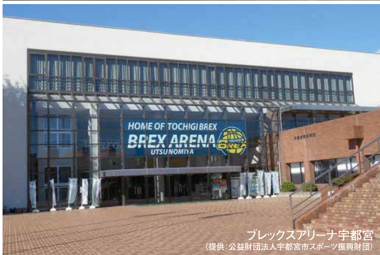
ブレックスアリーナ宇都宮