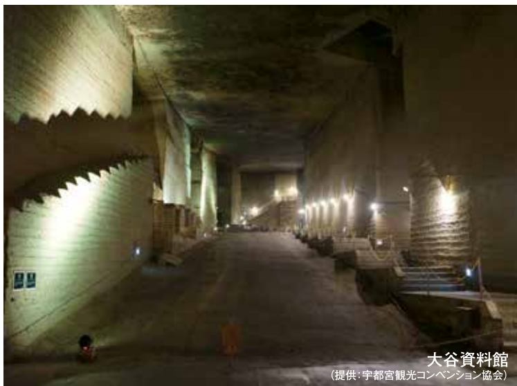
大谷資料館

⑥ 宇都宮市の名物といえばやっぱり餃子です。宇都宮駅を出るとたくさんの餃子屋さんが目に入りますが、宇都宮市民の多くは餃子屋といえば「みんな」か「正嗣(まさし)」の二党派に分かれます。具材や味付けがそれぞれ違い、どちらもとてもおいしいです。宇都宮に来たときはどちらがおいしいか是非食べ比べてみてください。また、毎年11月には「宇都宮餃子祭り」が開催されるので、餃子好きの方は是非食べに来てほしいです。