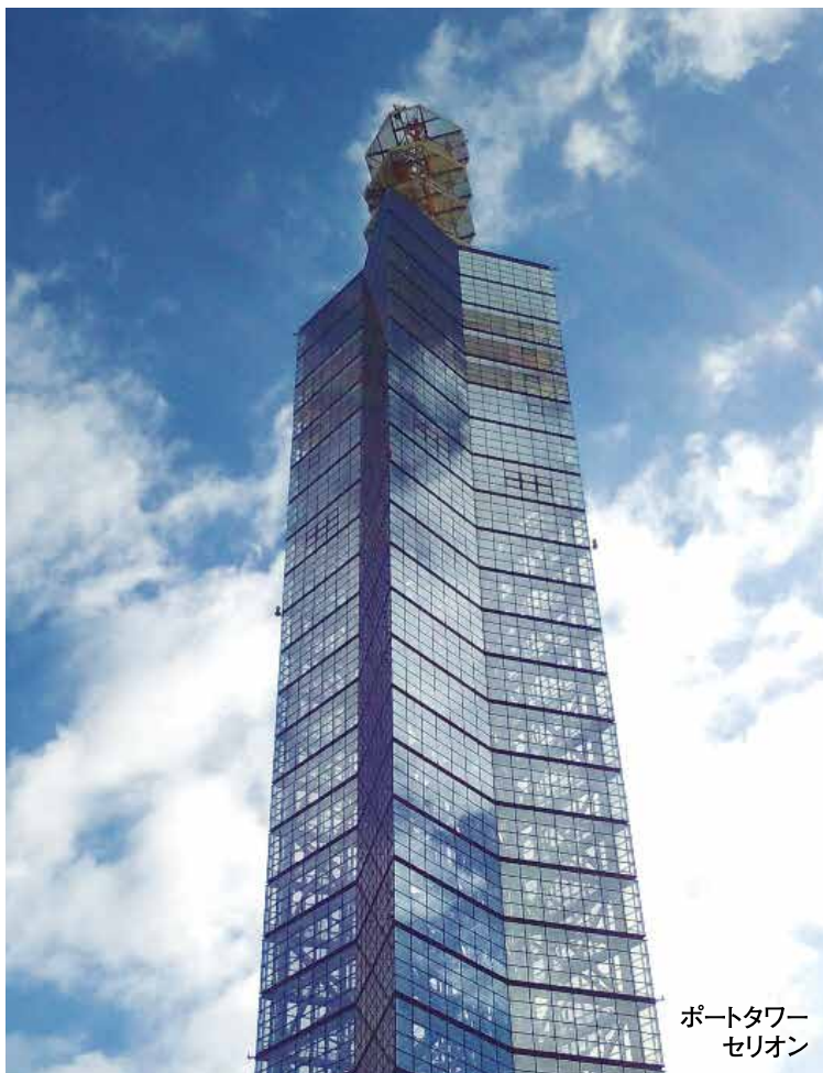
ポートタワーセリオン