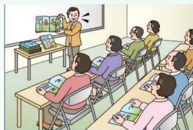
絵本の読み聞かせ法法の習得