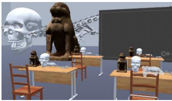
○ 文化財や生き物の3Dデータを配置したVR教室

私たちの身の回りには、日々、新しいメディアが登場します。新しいメディアを前向きに捉え、より効果的に、学校現場で導入・実践していくためにはどうすればよいか、そして、これらに対応できる教員の養成や児童生徒に求められる力について、学校の先生方と一緒に考えています。