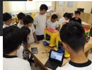
○ 3Dデータの作成と3Dプリンタでの出力