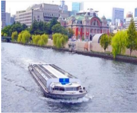
大阪国際平和センター ピースおおさか