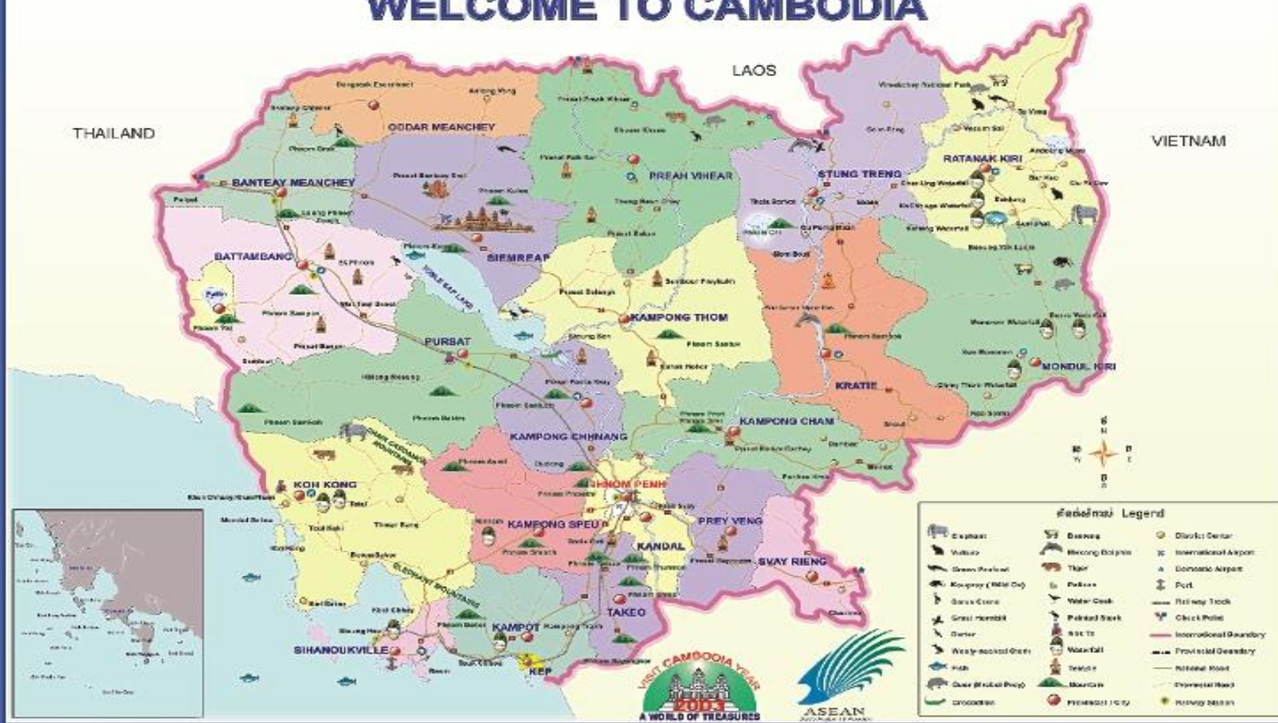
カンボジアのちず