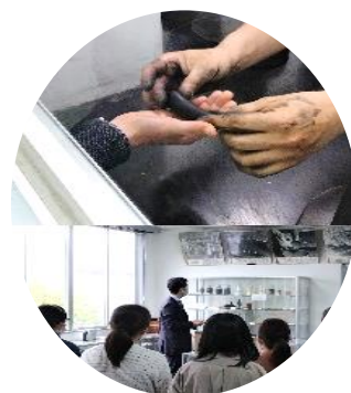
(株)墨運堂における見学風景