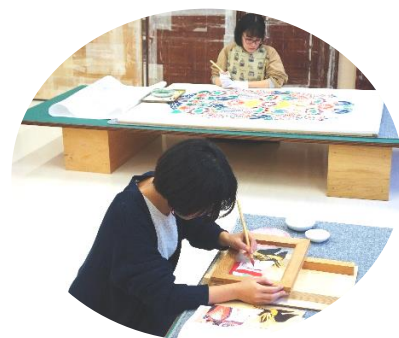
彩色文様の復元実習