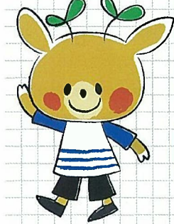
奈教イメージキャラクター「なつきよん」