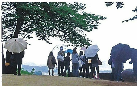
●甘樫の丘にて国見の歌を朗誦