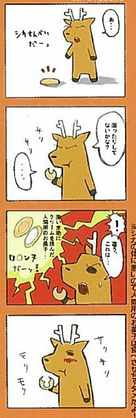
奈良・奈良教育大学 基礎研究