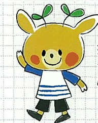
「なつきちゃん」 奈良ミュージックギャラリー

今年度の大学懇談会を12月10日に開催します。大学懇談会実行委員会では、一緒に大学懇談会を企画・準備してくれる学生さんを募集しています。興味のある方は、学生支援課学生担当までご連絡ください。