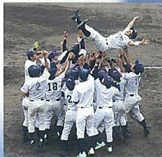
近畿学生野球II部春季リーグ優勝し、1部昇格した硬式野球部