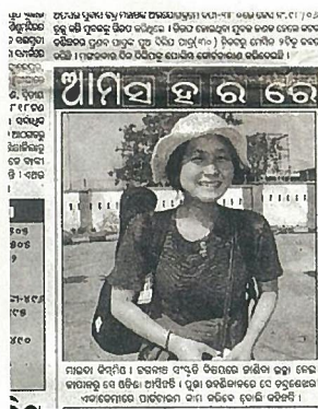
到着を待っていたカヌーマンに地元の産産を取材で、新聞に載りました。日本人の先生来るよーという文面