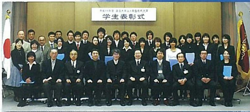
受賞者、保護者、指導教員等参加者全員で記念撮影